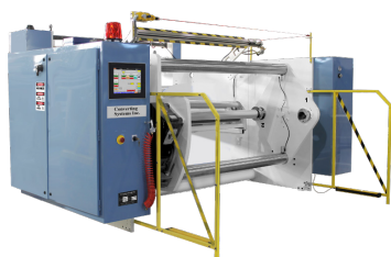
Bobinador de 40'' de diâmetro, torre simples Modelo 4001