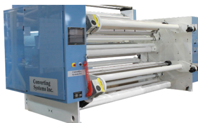
Bobinador de 24'' de diâmetro, torre dupla Modelo 2401