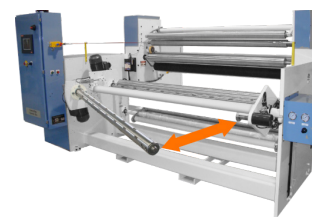
Bobinador de 16'' de diâmetro, torre simples Modelos CSI 1900 e 1900S0