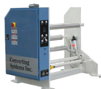
Bobinador simples Em balanço