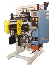
Bobinador sem tubete Modelo 825

A Converting Systems é especializada em uma variedade de bobinadores e desbobinadores para sua aplicação, incluindo Bobinadores movidos a torre central simples/dupla (com transferência automática, tensão gradual, acionamentos por fusos individuais e controles em tela tátil com microprocessador), bobinadores de aparas, re-bobinadores e desbobinadores acionados. Para bobinadores mais antigos, a CSI oferece upgrades no sistema de controle no local, além de serviços de reforma total, incorporando "novos" recursos às máquinas e garantia total por uma fração do custo de um novo bobinador. O "Programa de Empréstimo para Reformas" minimiza o tempo de parada.