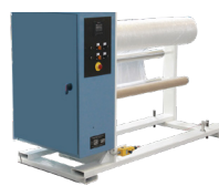
Bobinador com torque em balanço