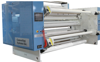
Bobinador con torreta doble de 24" de diámetro