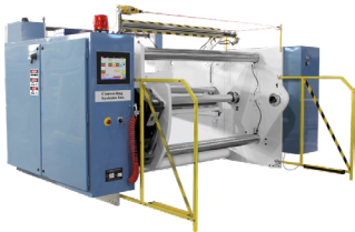
Bobinador de una torreta de 40" de diámetro