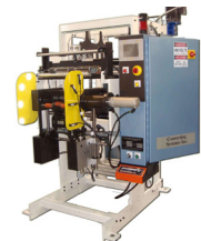
Bobinador sin Centro