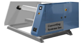
Desenrollador de Accionado Desde el Centro