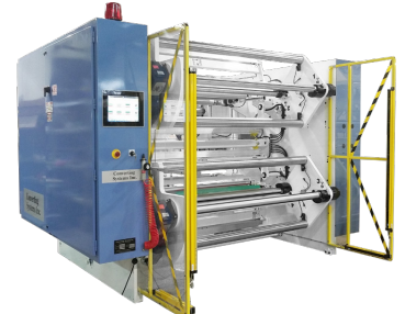
Bobinador con torreta doble de 30" de diámetro