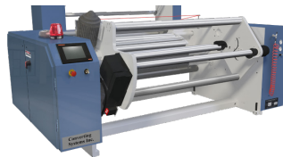
Bobinador de una torreta de 32"