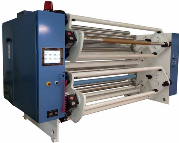
Bobinador con torreta doble de 30" de diámetro